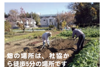
畑の場所は、社協から徒歩5分の場所です