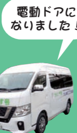
電動ドアはありません!

天王山・聖天→早稲田公園前 登山口南側 ↓ 洛和ヴィラ前 ↓ 大門脇南側 ↓ 円団南1棟南側 ↓ 二山小学校 ↓ 脇山公園階段下北側 ↓ 町駐車場前 ↓ ラプリー円明寺前 ↓ 里ノ後北側←西法寺バス停西側