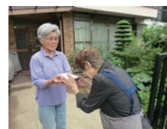
ボランティア虹の会による配食