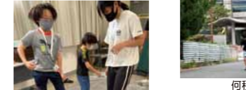
こちらは、簡易段ボールベッド

7/26(月)「社協って」 段ボールと新聞紙で防災スリッパの製作やマンホールトイレを体験。