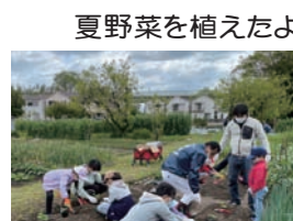
夏野菜を植えたよ