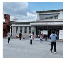
まずは、みんなでOH!やまざき体操♪

活動報告 たくさんの地域ボランティアさん協力のもと、蒸しパン作りやシラスリポンについての学習会、食品提供を実施しました。