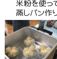
米粉を使って蒸しパン作り